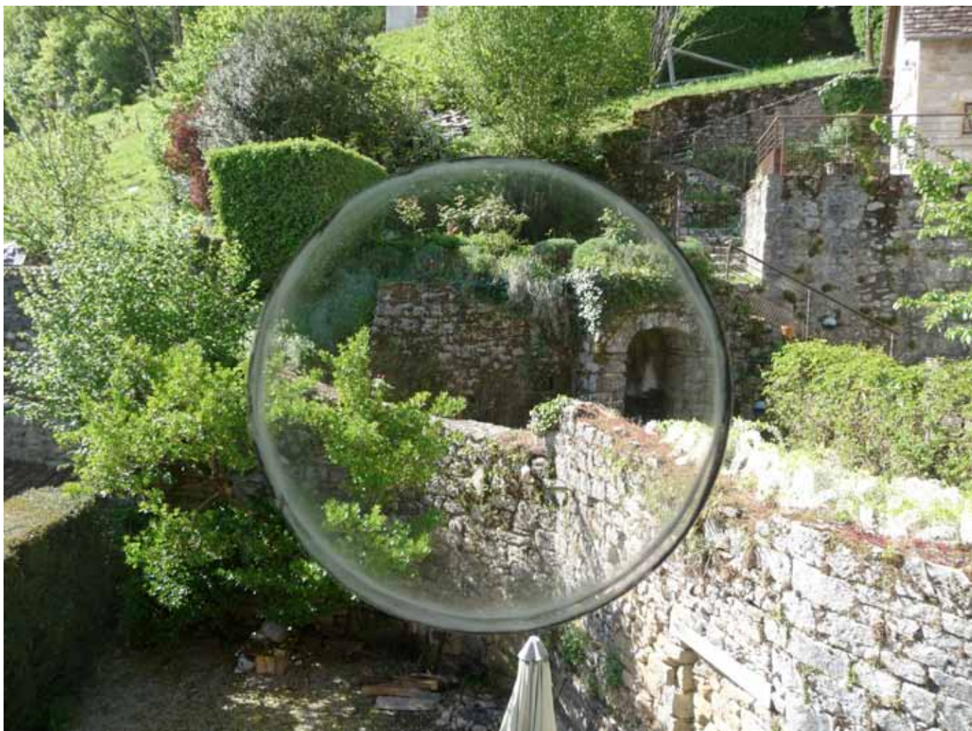
Vues de l'atelier de Géraud Soulhiol aux Maisons Daura Avril 2017