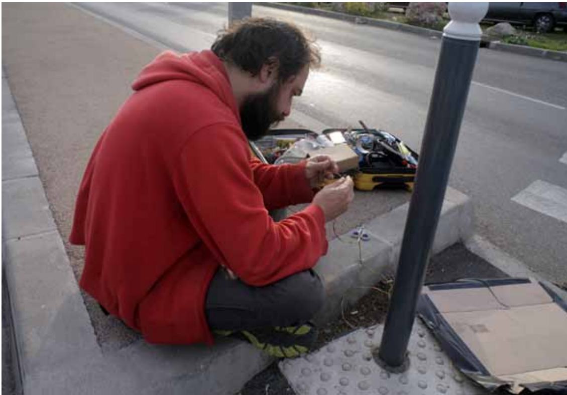
Poussoir détente / canette inox Direct Out