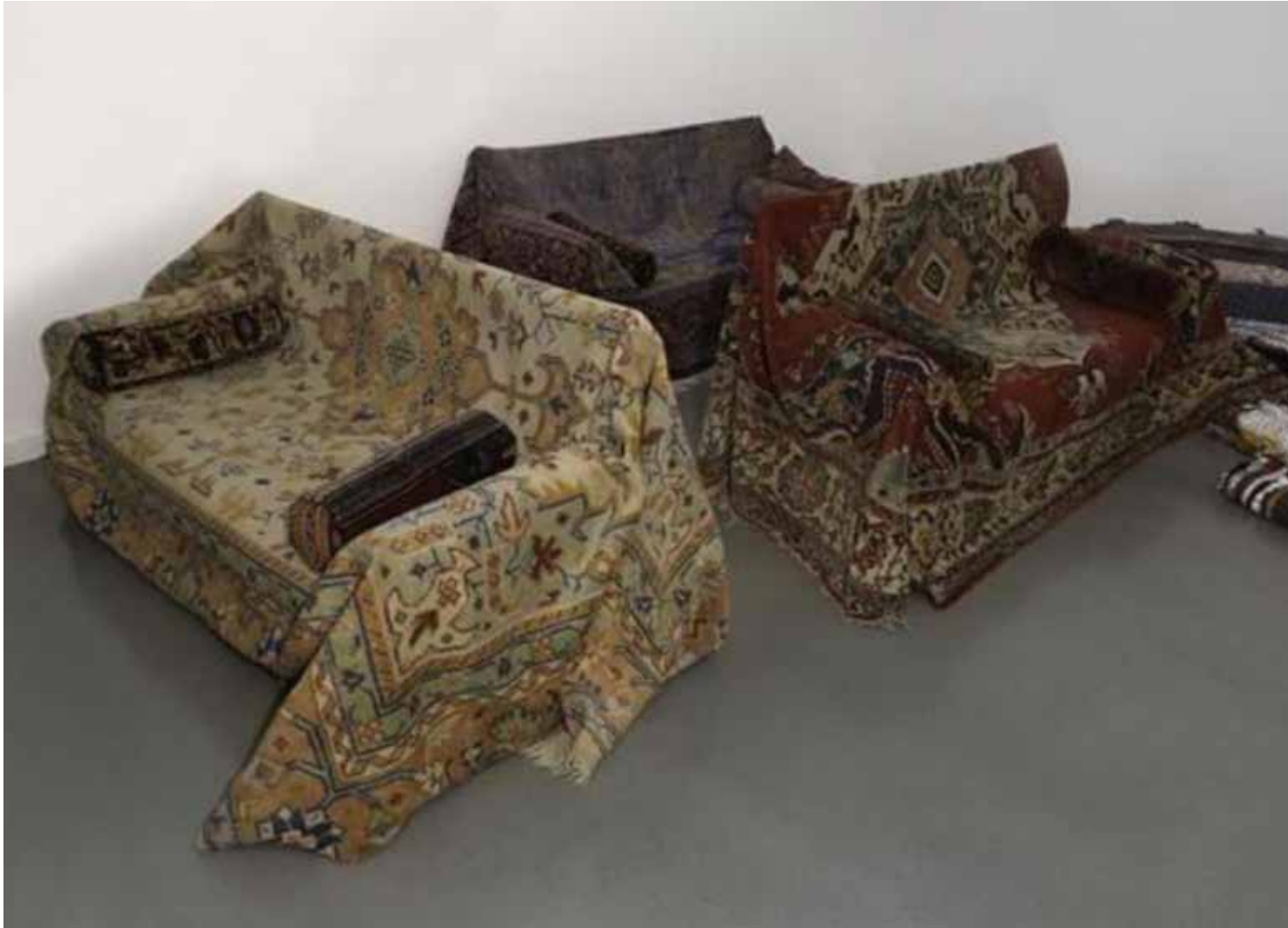
Auditorium Franz West 1992