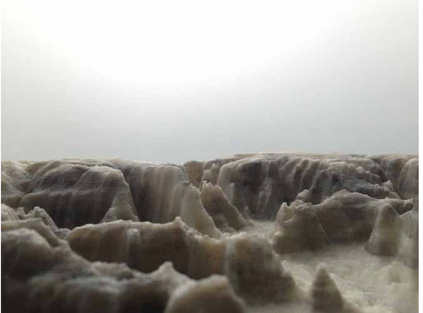
Eolorium Marie-Luce Nadal Installation 2013