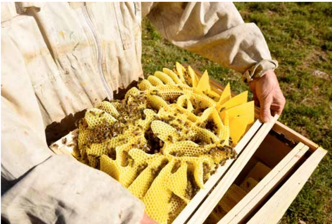
L'espace - avant Cire d'abeille, cadres de bois, inox. 2017

Vue de L'espace en cours de modification par les abeilles, Rucher d'Alain Klein, Cabrerets, Avril 2017